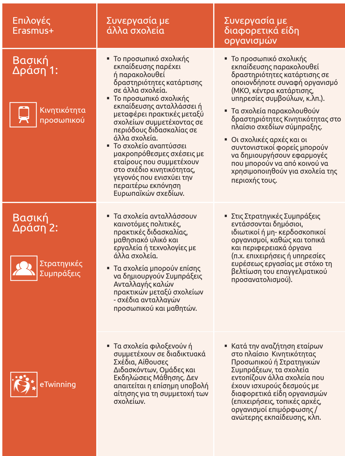
Πίνακας 1: Το Erasmus+ πλοηγός στις ευκαιρίες